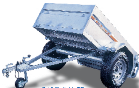
- BASCULANTE MANUAL