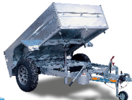
- BASCULANTE HIDRÁULICO