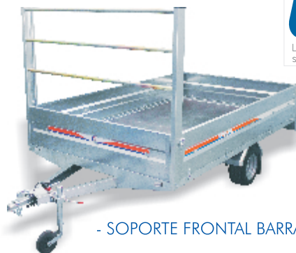
- SOPORTE FRONTAL BARRAS