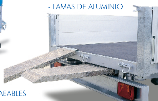
- LAMAS DE ALUMINIO