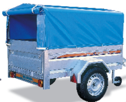
- LONA ALTA